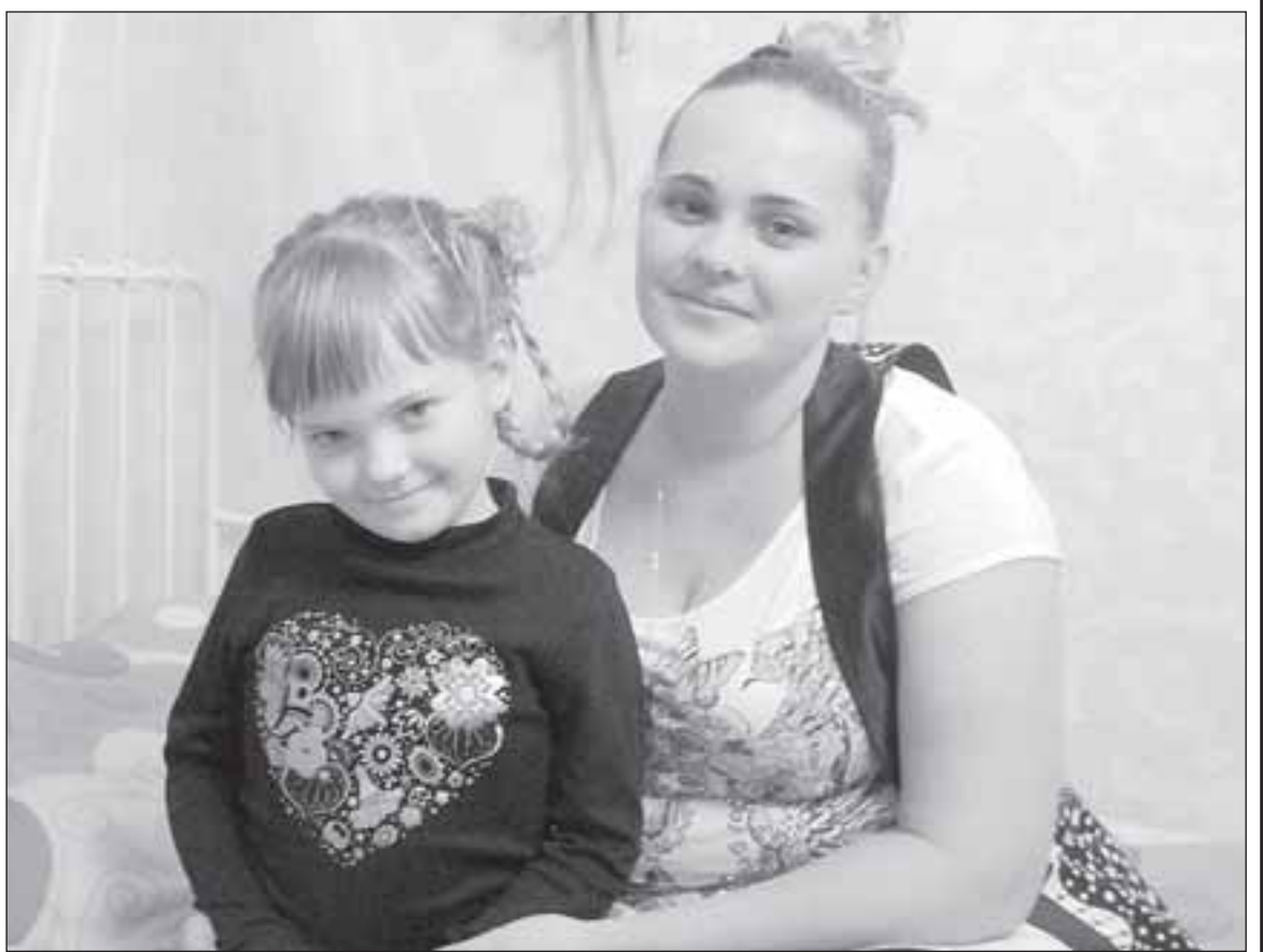
■ ЖИЗНЬ ЗАМЕЧАТЕЛЬНЫХ ЛЮДЕЙ